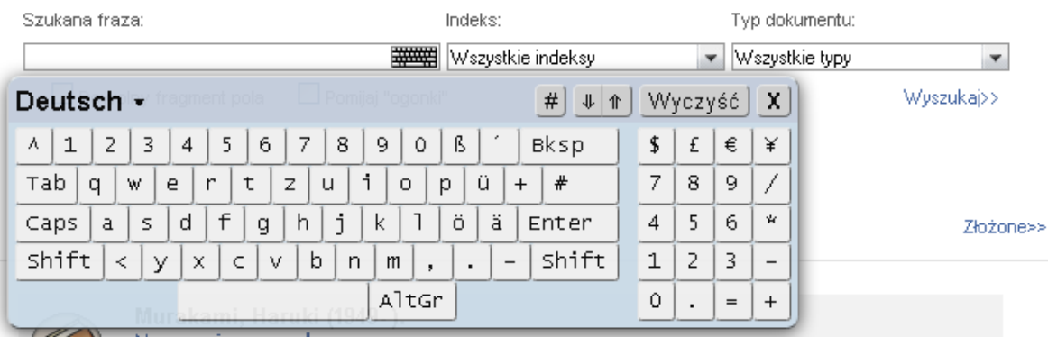
Rysunek 69. Klawiatura ekranowa.

Ponadto wyszukiwarka posiada funkcję transliteracji literk sprawiających trudności podczas wyszukiwania. Na przykład: niemieckojęzyczną książkę pod tytułem „Rädern” można wyszukać wpisując zamiast niemieckiego znaku „ä”, polską literkę „a”.